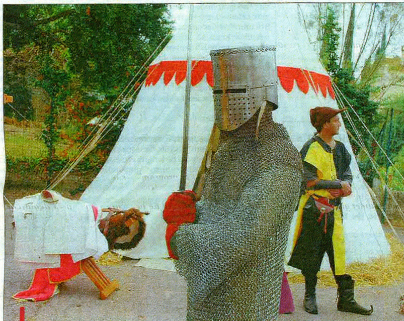
Chevaliers en armure, nobles, saltimbanques, campements du XIII e et du XV e siècles... sont encore à découvrir aujourd'hui.